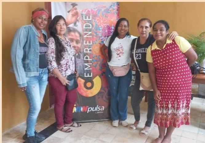
Mujeres participantes de la Seccional Cartagena a la ruta de fortalecimiento a emprendedores